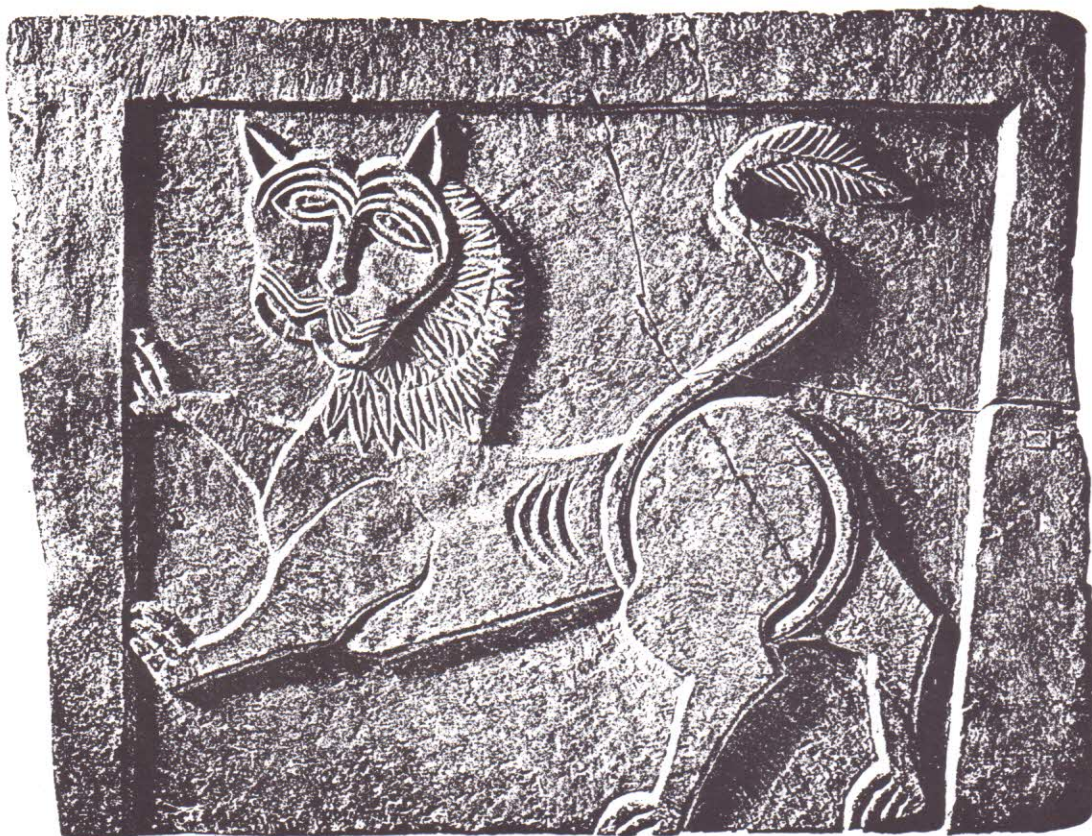
-STARA ZAGORA - LION XI - XII Century