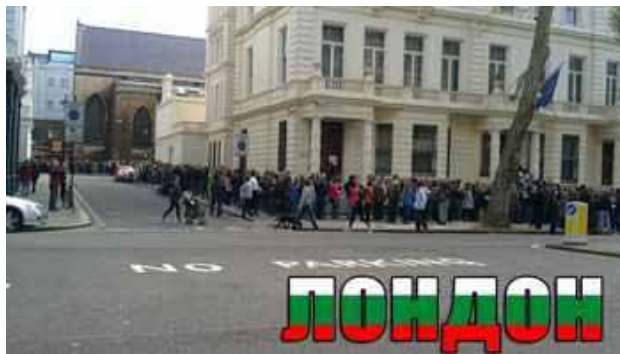
Часове наред се чакаше за гласуване в посолството в Лондон при старите правила. При новите – гласуването ще е почти невъзможно.

В стенограмата, за съжаление, намирам свидетелства за точно обратното. Ваши две реплики за изборите в чужбина – „...Изборният кодекс създава възможност да се разкрие секция при 20 заявки, а в деня на изборите отиват да гласуват примерно петима души.“, както и „Най-фрапантното е, когато броят на гласувалите е по-малък от членовете на секционните комисии, чийто състав е командирован от българската държава за три дни, за да отидат там и да гарантират честни избори.“ – са базирани на един единствен, еди-