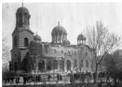
Храмът след атентата от 1925 г.

Преди 90 години – на 16 април 1925 г., верни на терористичната и рушителната си природа, българските комунисти, вдъхновени поръчково от вождовете си Георги Димитров и Васил Коларов, извършиха чудовищен терористичен акт, като взривиха катедралния храм „Св. Неделя“ с желание под развалините му да намери смъртта си и тогавашният български цар Борис III, който се е предполагало, че ще бъде в храма по това време. Вместо него там намериха смъртта си стотици невинни граждани. Днес техните следовници са първи под знамената на антитероризма. Това не им пречи да издигат паметници и с имената на вдъхновителите си да назовават градове, местности и улици в Родината ни.