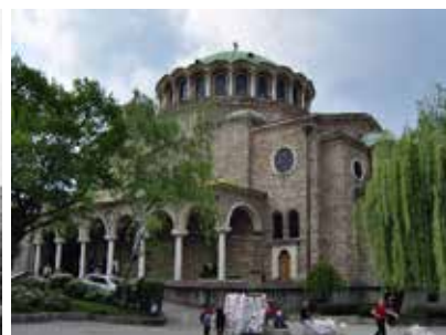
Възстановеният храм днес