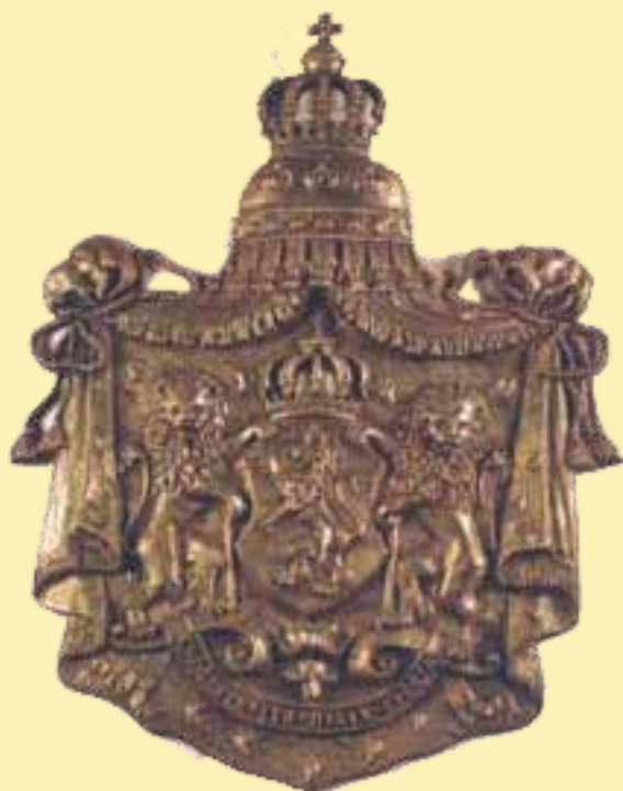
Първият български герб след Освобождението