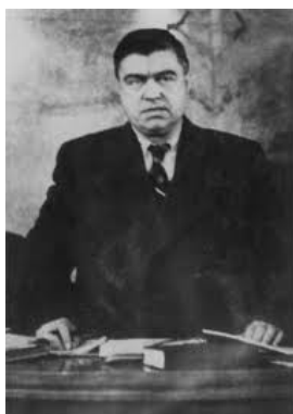
Главният обвинител Георги Петров

обявяват официално в документите си. Намират политически противници, виновни за провала на каузите им, и ги разстрелват. Това продължава до 1923 г., когато БКП прави Септемврийското въстание. На практика това е насилие, но до ден-днешен някои го разглеждат като въстание на справедливостта. Стигаме до 1925 г. и атентата в църквата „Св. Неделя“, когато държавата решава да отговори на удари. Според някои колеги историци започва граждански конфликт. Това е спорно, но е вярно, че терорът и реакцията на държавата се нагнетяват от двете страни. Сблъсъците (дори въоръжените) между партизани и жандармерия, а по-късно между горяни и милиция могат да се окачат като гражданска война. Народният съд няма място в тази система на сблъсъци. Той