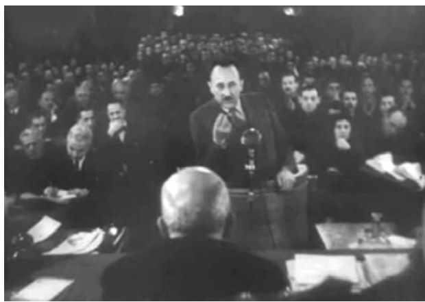
Принц Кирил пред народния съд

И в двете съдилища обект е политическата върхушка. Но в Нюрнберг трибуналет е международен, а народният съд у нас е дело на БКП и партньорите ѝ, които малко по-късно сами попадат под същите репресии. Първо се удрят десните, после левите, за да останат комунистите сами. Факт е, че през 1990 г. СДС се създаде като антикомунистическа организация от забранените леви партии – БЗНС „Н. Петков“ и социалдемократите. Десните са били физически унищожени.