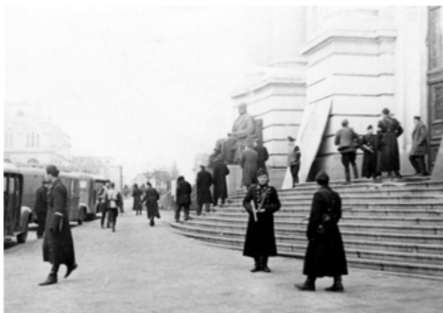
Милицionери охраняват Софийския университет, в който заседава съдът