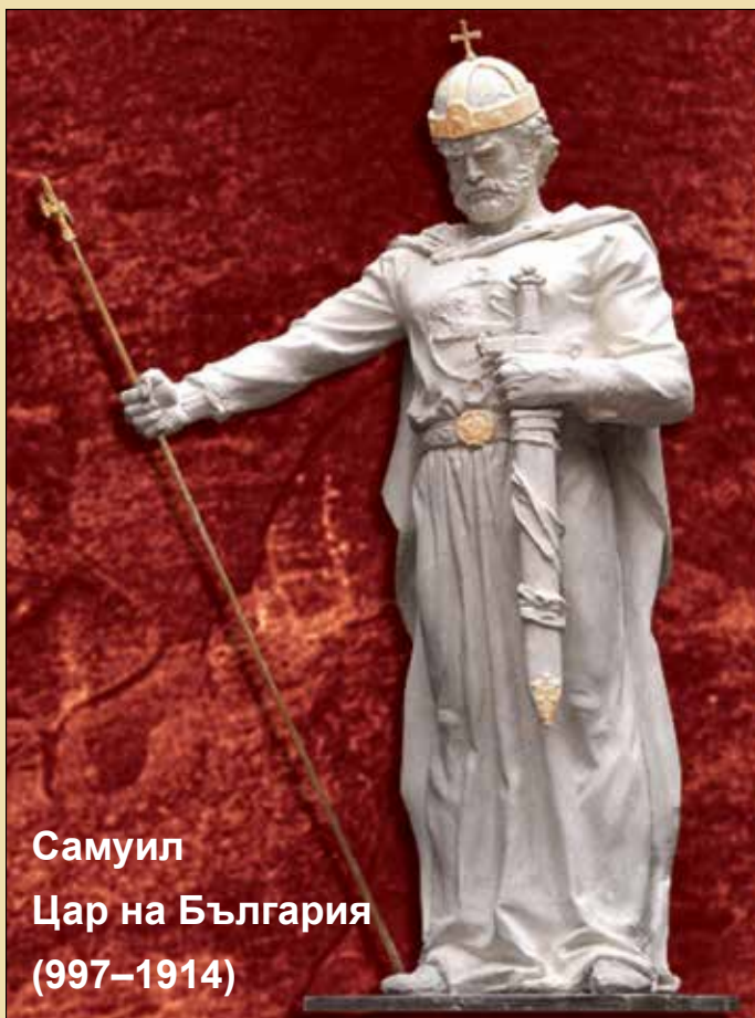
Самуил Цар на България (997–1014)