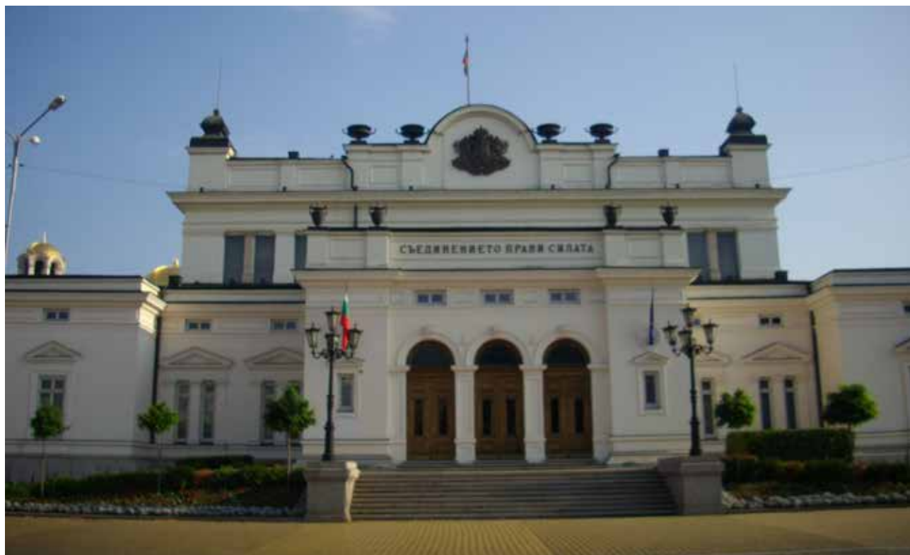
Сградата на българския парламент, в който заседава 43-то Обикновено народно събрание

Редакционна: В много от получените в редакцията на „Борба” писма след парламентарните избори от 5 октомври 2014 г. за 43-о Обикновено народно събрание се отправя молба към редакцията на списанието при възможност в следващ негов брой да бъде отразена по-обширна информация за изборните резултати (състав на представените в парламента и правителството политически сили). Отговорът на тази читателска молба интересующите се ще намерят в следващите страници.