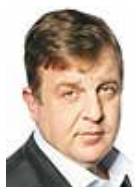
Красимир Дончев Ка- ракачанов