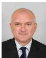
Димитър Борисов Главчев