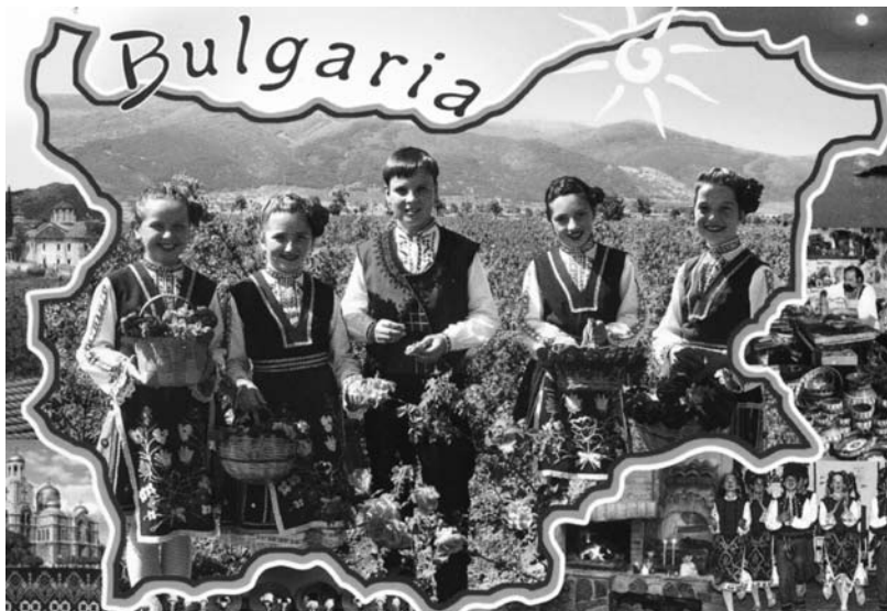
Деца на България – утрешни носители на законодателната, изпълнителната и съдебната власт

Преживяванията обединяват човешките съдби, обновяват намеренията и с една надежда в очакване на по-добро време, което все така не идва, се моделират стъпките ни в перспектива. Българинът е петимен по нов начин да осмисли живота и действията си, чрез зрелостта на своите убеждения. Силата е в родителството, което обединява в себе си най-съкровени пластове на психичното функциониране. Почувства ли тази необходимост, желанията стават неугържими,