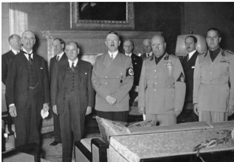
Прословутото Мюнхенско споразумение, 28-29 септември 1938 г., на което се възлагат неоснователни надежди за спасяване на мира. Отляво надясно: Невил Чембърлейн (Великобритания), Едуард Даладие (Франция), канцлерът Хитлер, Мусолини и граф Чано

На 22 септември в Годесберг, Рейнска област, се състои втора среща между Чембърлейн и Хитлер. Англичанинът ужасен