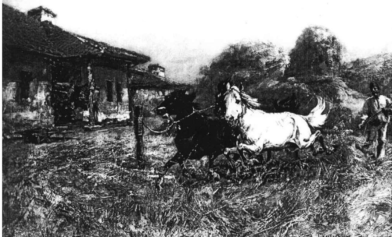
Софийска градска художествена галерия – Ярослав Вешин (1860-1915)