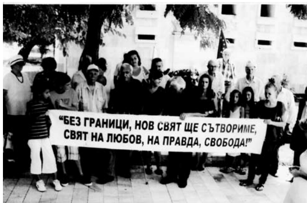
27 юли 2012 г. – Част от поклонниците на Кръстьо Хаджииванов пред паметника му в Сандански

митингите, където вдъхновява с декламациите си стотици българи и гърци, които след него маршируват и пеят „Тих бял Дунав” и „Жив е мой, жив е”.