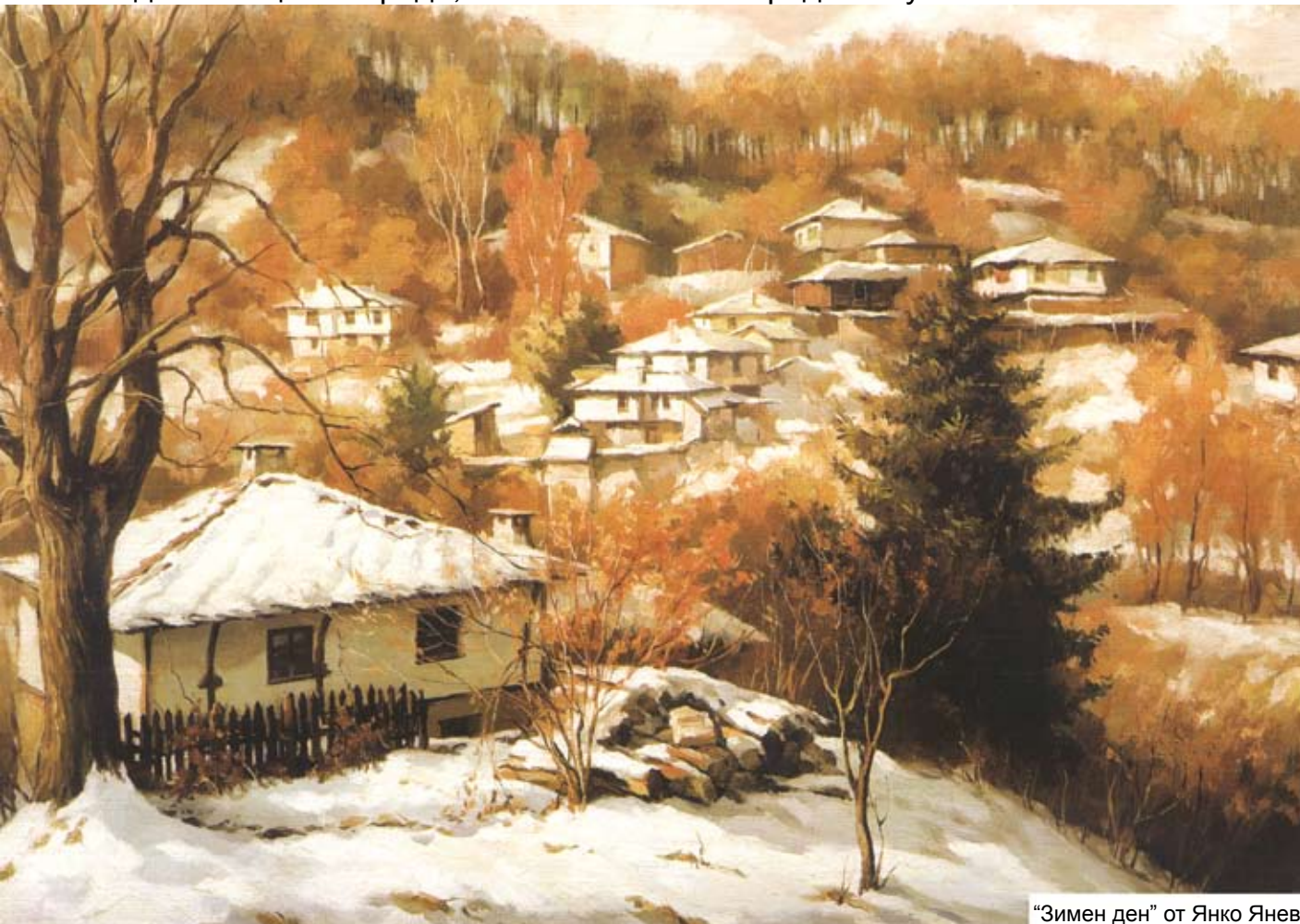
“Зимен ден” от Янко Янев

Новогодишен поздрав от Българския национален фронт на българите по света с увереността, че Родината ги очаква с общи усилия да я върнем в призовото място на благоденстващите народи, което тя заемаше преди комунистическото нашествие