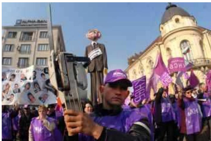
Чучело на Дянков бе развявано пред парламента