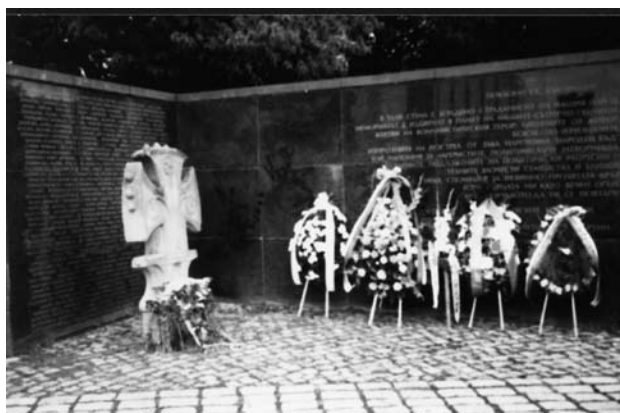
Част от паметната стена с имената на жертвите на комунизма