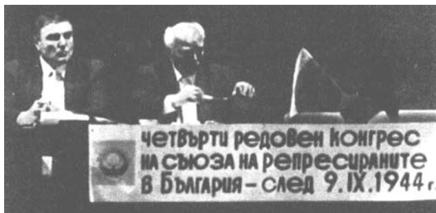
9 септември 1944 г. да се обяви за Ден на национален траур

4. членовете на други политически партии.