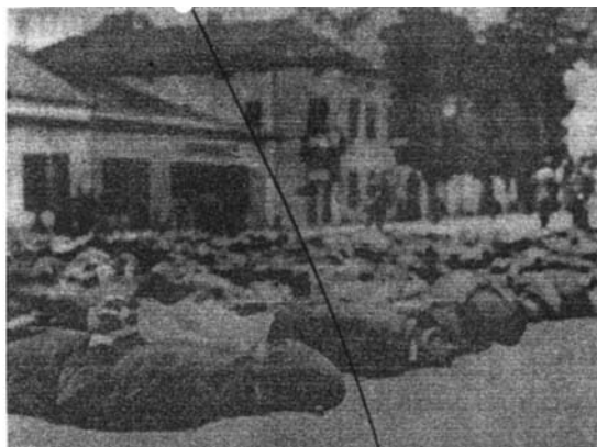
Навързани на площада въ с. Новоселци 56 български патриоти очакват екзекуция на 9 септември 1944 г.