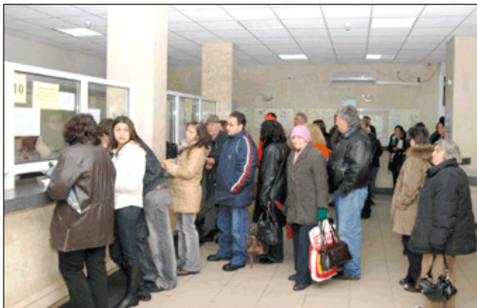
Опаиците пред бюрата по труда ще продължават да се увеличават

Третата власт – правораздавателната, която е призвана да бди за изпълнението на законите, ги е оставила на автопилот. Органите на вътрешното министерство, чието предназначение е главно да охраняват и бдят за мирния труд на гражданите и обществения ред да се движи в рамките на закона, действат прекалено внимателно, за да не предизвикат нежелани последици в тази взривоопасна кризисна атмосфера, което още повече съдейства да ескалират противообществените и противозаконни прояви. Закодираните под прикритие противници на промяната от 10 ноември 1989 г., принадлежащи към бившата комунистическа управленска система,