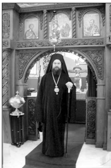
Бранички епископ Гервасий

“Де ти е, смърте, жилото? Де ти е, аде, победата?”