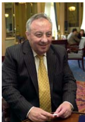
Класация: Георги Гергов е пръв в листата на богатството в БСП

Това наистина е две в едно – капитализъм в действие и социализъм да се съберат в джоба на БСП без конфликт на интереси.