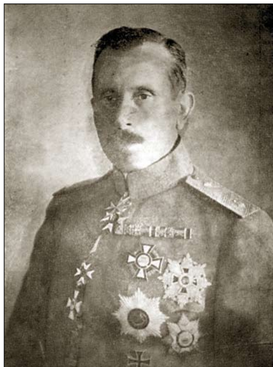
Ген. Никола Жеков

Това, което става в президентството и извън него, е вече съвсем ясно. Не е ясно кога тази гмеж от предатели начело с агента "Гоце" ще бъдат заставени да напуснат дипломатическия корпус и президентството.