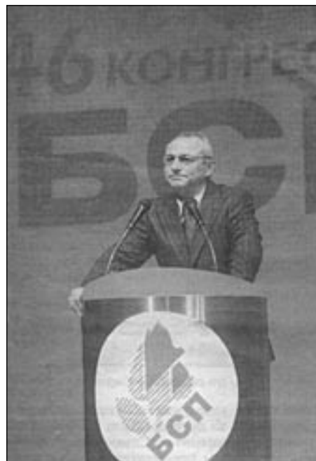
Ахмед Доган поздравява конгреса на БСП, в. “Сeга”, 7 дек. 2005 г.

За изтичането на секретната информация тогава са уведомени президентът, премиерът, председателят на парламента, военният и вътрешният министър, но всички възприемат тезата, че това е интрига на Държавна сигурност, която цели да дискредитира първото ни демократично правителство. Извършеното престъпление срещу държава е укрито, но последвалият “депесарски шут” срещу премиера Филип Димитров дава първия сериозен сигнал, че Ахмед Доган ще изпълнява ролята на балансър в