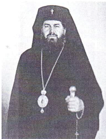
† ИНОКЕНТИЙ Наместник-Прегсегател на Светия Синод и Софийски Митрополит

"Слава във висините Богу, и на земята мир, между човеците благоволение" (Лук. 2:14)